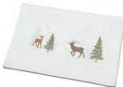
1XM478.10 runner bianco renna e albero runner with reindeer and tree, white 50x140

Runner con ricamo, bianco. Runner with embroidery, white.