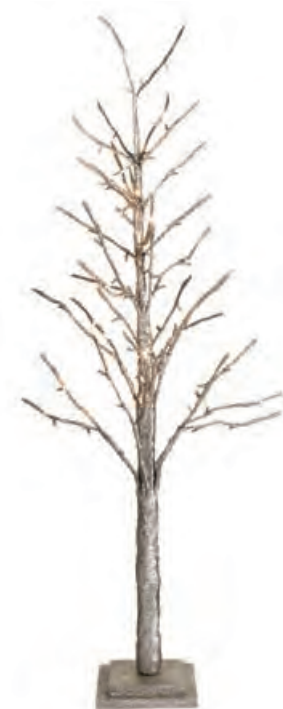
1XM430.10 albero 114 leds tree 114 leds 120h

Elementi decorativi con luce led _ alimentazione 220V. Decorative objects with led light _ 220V power supply.