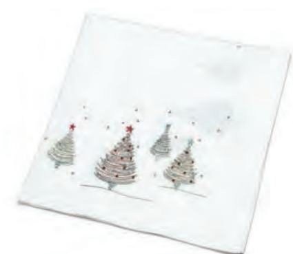
1XM479.11 tovaglia bianca alberi tablecloth with trees, white 85x85