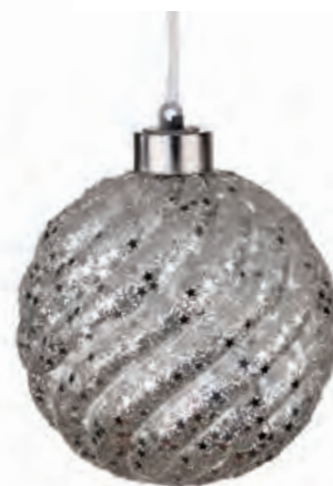
1XM426.12 palla grande · 3 large ball · 3 ø 10 AG13