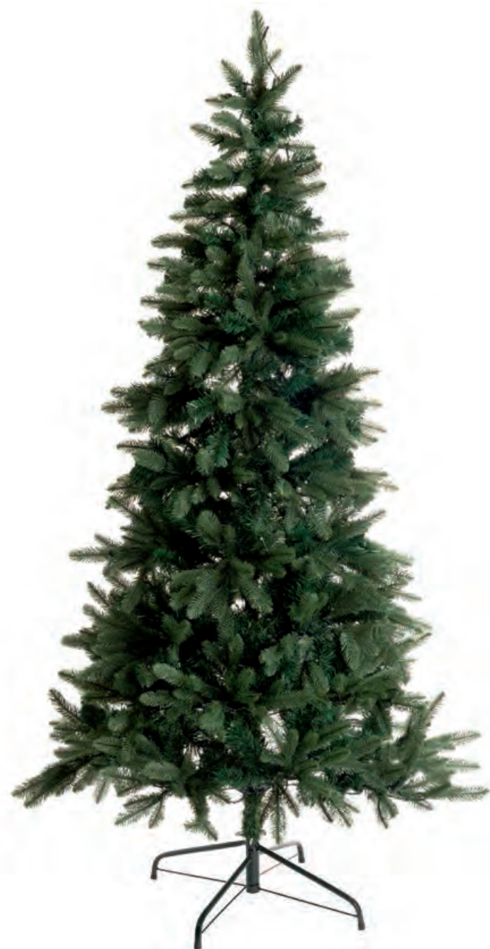
albero verde green tree 1XM401.10 120h _ 110 leds 1XM402.10 180h _ 280 leds 1XM403.10 210h _ 370 leds

Alberi di Natale, con led _ alimentazione 220V. Christmas trees, with leds _ 220V power supply.