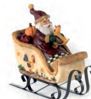
1XM440.11 Babbo Natale con slitta Santa Claus with sleigh 16x6x16h