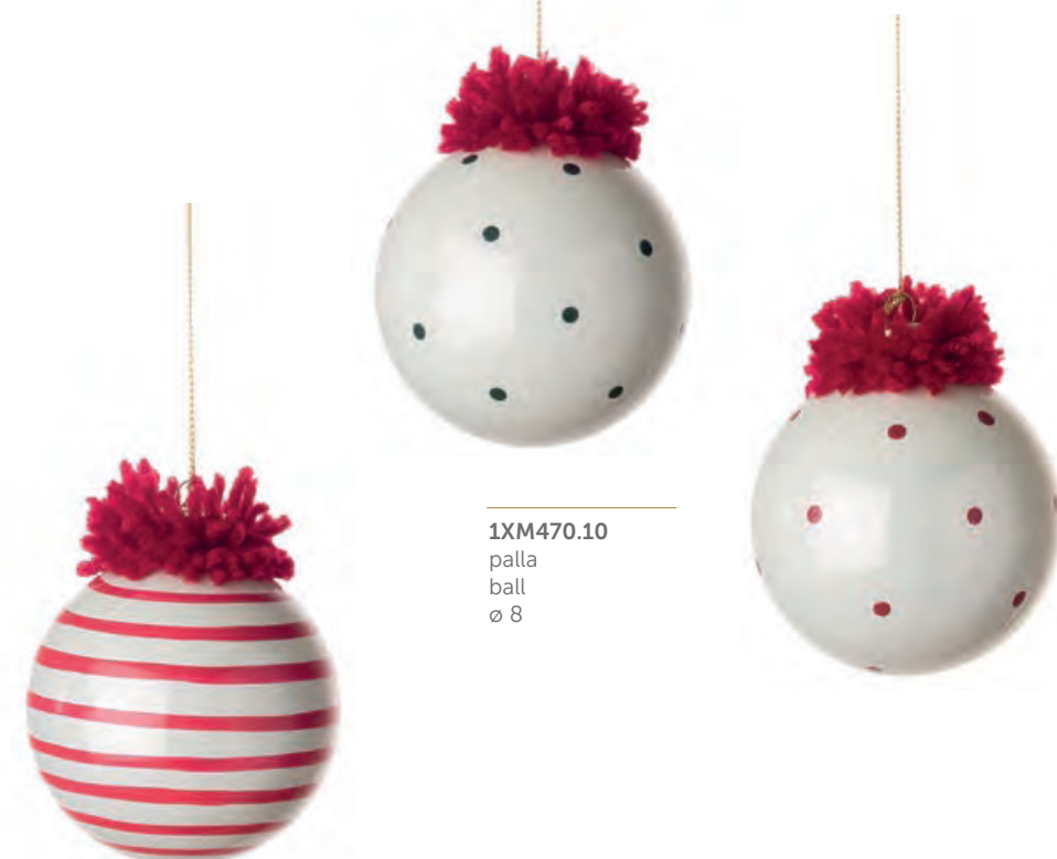
1XM470.10 palla ball ø 8

Decorazioni da appendere, vetro, set 3 pcs. Hanging glass decorations, set 3 pcs.