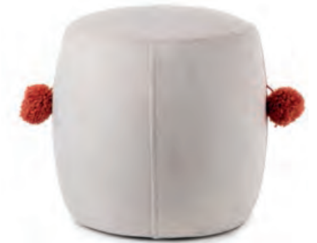
1XM460.12 mini pouf beige mini pouf, beige ø 30x30h