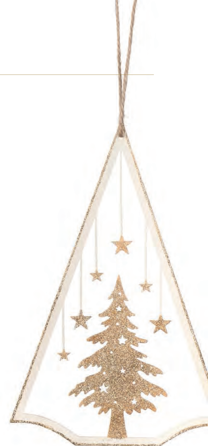
1XM434.13 albero grande large tree 21h