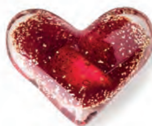
1XM462.10 press-papier cuore rosso heart paperweight, red 9x8x3,5