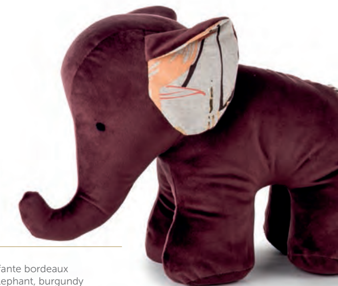
1XM461.14 fermaporta elefante bordeaux door stopper elephant, burgundy 28x13x22h