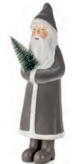
1XM467.13 Babbo Natale grande grigio large Santa Claus, grey 12x12x42h