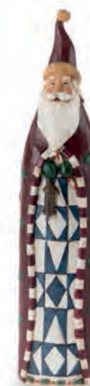
1XM440.14 Babbo Natale con lanterna Santa Claus with lantern 6x4x29h