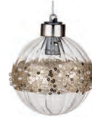
1XM425.11 palla piccola · 2 small ball · 2 ø 8 AG13