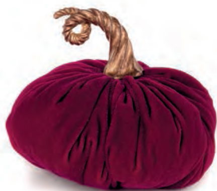
1XM438.12 zucca media magenta medium pumpkin, magenta ø 18x15h