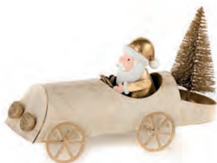
1XM435.13 macchina con Babbo Natale car with Santa Claus 17x6x10h