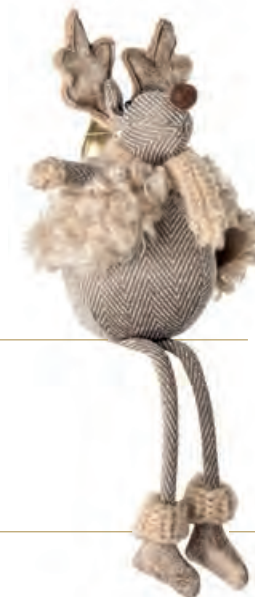
1XM456.10 alce piccolo small elk 12x15x37h