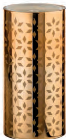
1XM427.13 fontana luminosa · 4 luminous fountain · 4 ø 10x20h C

UN BAGLIORE DORATO COLORA LE PARETI, LO ZAMPILLÒ DELL'ACQUA È UNA CANZONE DELICATA E MISTERIOSA CHE ACCOMPAGNA I PENSIERI PIÙ SERENI