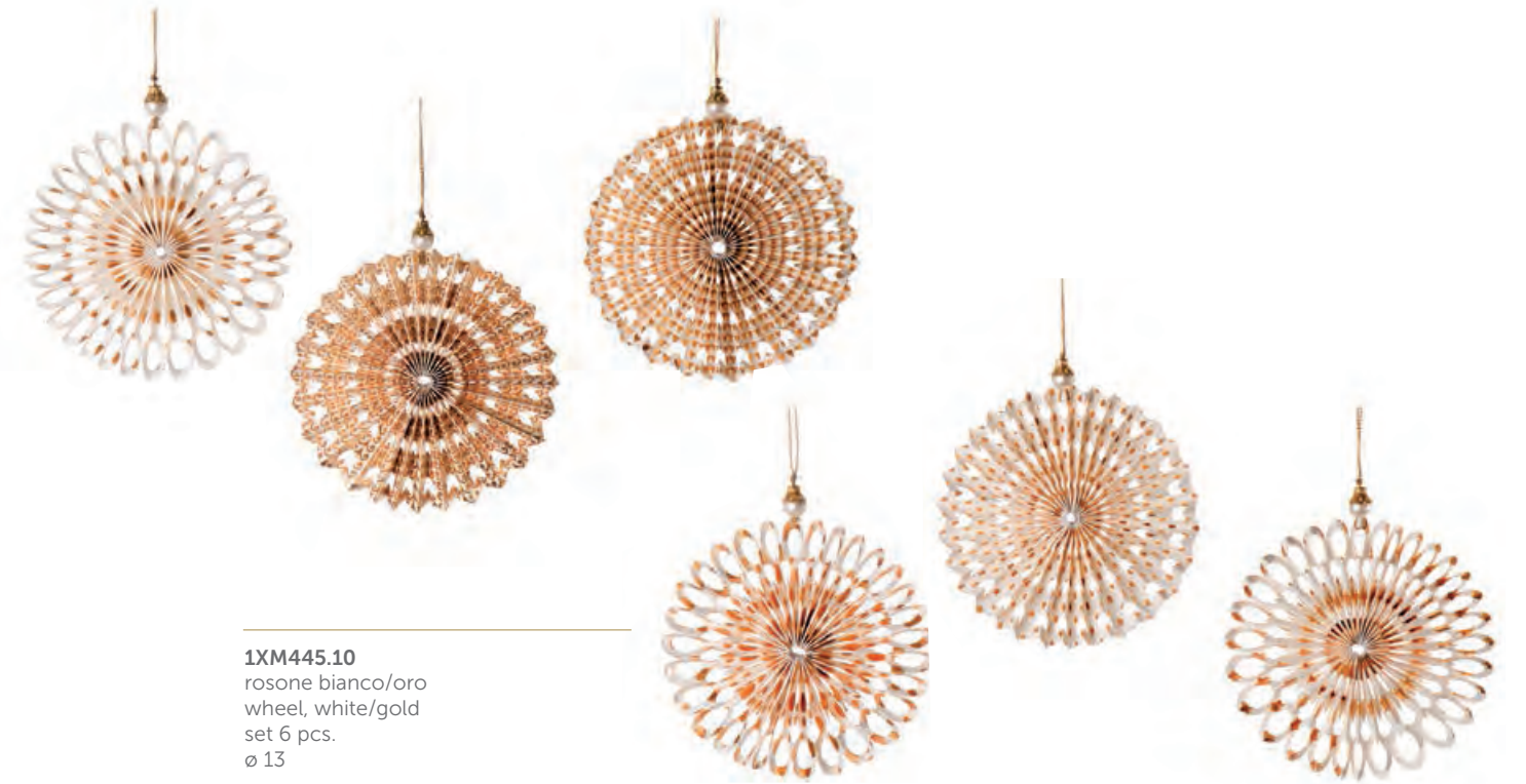
1XM445.10 rosone bianco/oro wheel, white/gold set 6 pcs. ø 13

Decorazioni da appendere, carta. Hanging paper decorations.