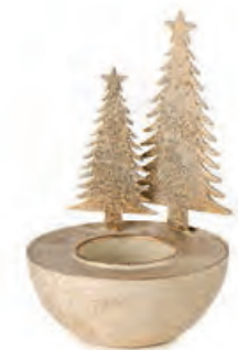
1XM436.12 porta t-light alberi con t-light t-light holder trees with t-light ø 8,5x13h