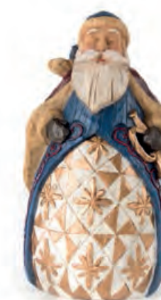
1XM440.18 Babbo Natale con trombetta Santa Claus with trumpet 14x15x25h