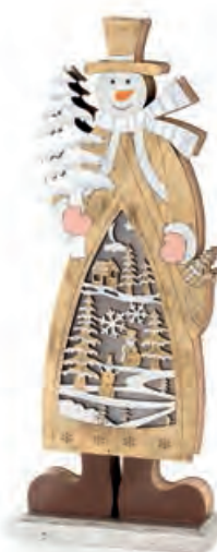
1XM421.17 pupazzo di neve grande large snowman 12x6x33h AAA