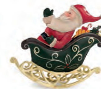
1XM443.11 slitta con Babbo Natale sleigh with Santa Claus 13x3x12h