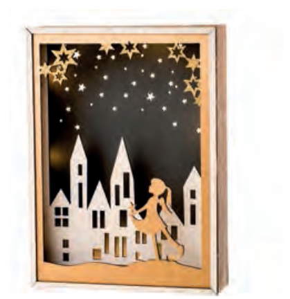
1XM422.11 paesaggio con bambina, con led landscape with little girl, with leds 22x6x30h AA