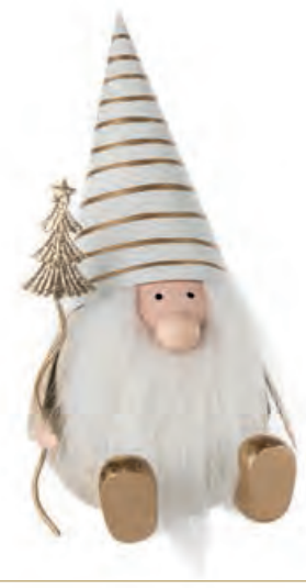
1XM436.18 gnomo grande con albero large gnome with tree 17h