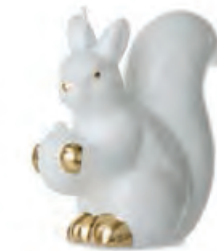
1XM428.12 scoiattolo con ghianda squirrel with acorn 11h