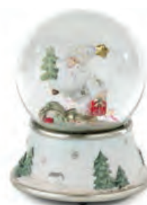
1XM449.10 boule de neige Babbo Natale snowball Santa Claus ø 11x13h