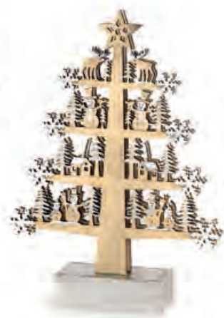
1XM421.12 albero piccolo small tree 20x5,5x27h AA