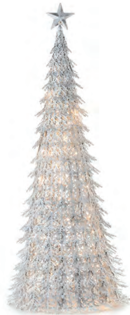
1XM485.10 albero grande large tree ø 32x80h

LUCI D'INCANTO Elementi decorativi in metallo con luce led _ alimentazione 220V. Metal decorative objects with led light _ 220V power supply.