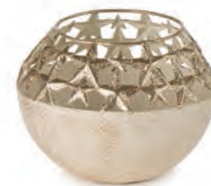
1XM436.13 porta t-light stelle piccolo con t-light small t-light holder stars with t-light ø 11x8,5h