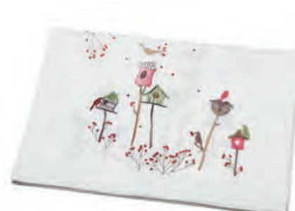
1XM478.12 runner bianco casette runner with houses, white 50x140