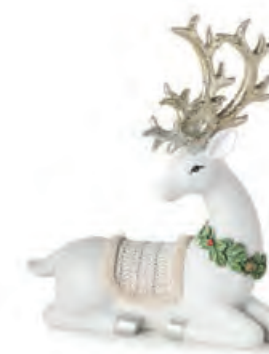
1XM448.10 renna seduta sitting reindeer 15x5x18h