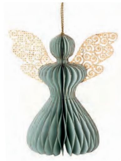
1XM447.13 angelo grande verde large angel, green 9x13,5x15h