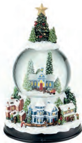
1XM483.10 boule de neige · 1 snowball · 1 ø 14x22h

Boules de neige, con carillon. Snowballs with music box.