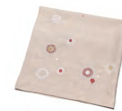
1XM482.12 tovaglia ecrù palle tablecloth with balls, ecru 85x85