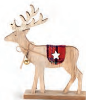
1XM423.12 renna piccola small reindeer 17x4x20h