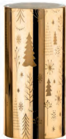
1XM427.12 fontana luminosa · 3 luminous fountain · 3 ø 10x20h C