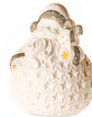
1XM439.15 Babbo Natale Santa Claus ø 19x23h AA