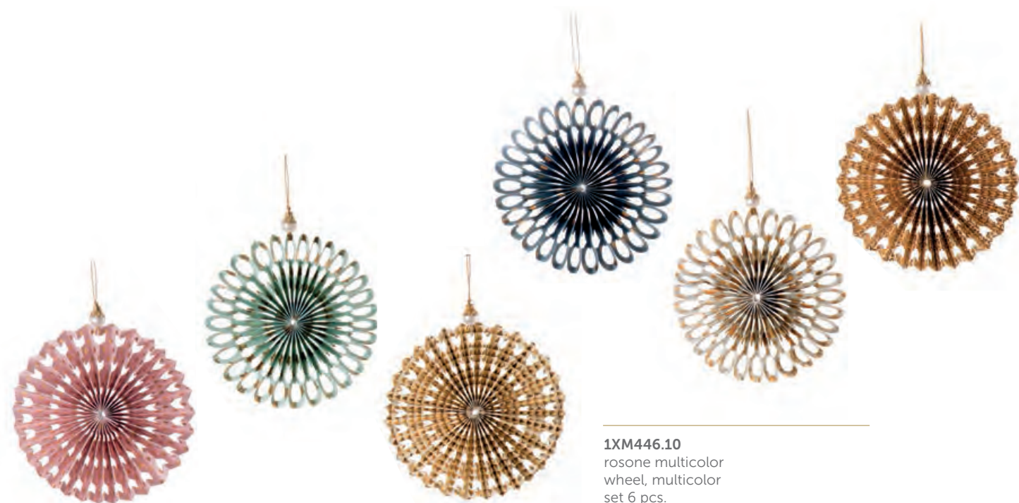
1XM446.10 rosone multicolor wheel, multicolor set 6 pcs. ø 13

Decorazioni da appendere, carta. Hanging paper decorations.