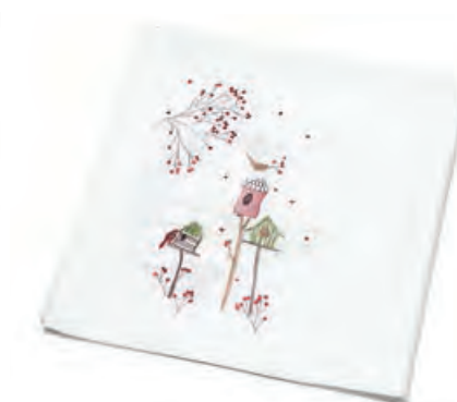
1XM479.12 tovaglia bianca casette tablecloth with houses, white 85x85