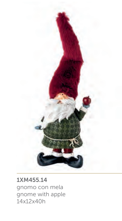
1XM455.14 gnomo con mela gnome with apple 14x12x40h