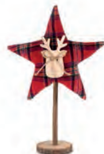
1XM423.14 stella star 26h

Decorazioni da appoggio. Standing decorations.