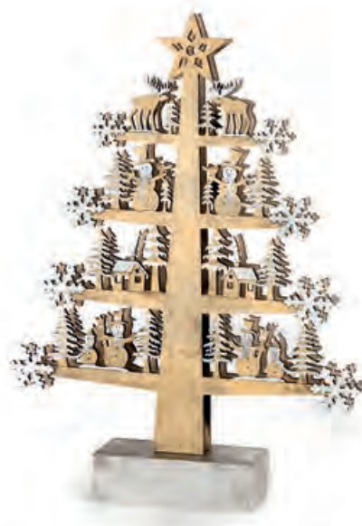
1XM421.13 albero grande large tree 27x6x37h AA

Decorazioni in legno con luce led, da appoggio _ batterie AA · AAA _ batterie AG13 comprese. Standing wooden decorations with led light _ AA · AAA batteries _ AG13 batteries included.