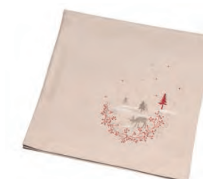
1XM482.11 tovaglia ecrù alberi e renna tablecloth with trees and reindeer, ecru 85x85