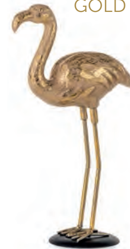
1XM472.12 fenicottero · 2 flamingo · 2 12x6x24h

Decorazioni da appoggio. Standing decorations.