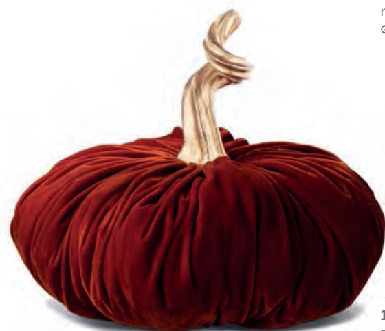
1XM438.14 zucca grande marrone large pumpkin, brown ø 25x22h