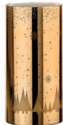
1XM427.10 fontana luminosa · 1 luminous fountain · 1 ø 9x18h C

Decorazioni da appoggio con luce led _batterie C comprese, con telecomando. Standing decorations with led light _ C batteries included, with remote control.