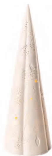
1XM453.14 albero piccolo small tree ø 11x34h AA