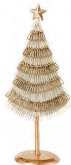
1XM435.16 albero piccolo small tree 29h