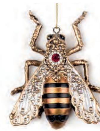
1XM437.13 bijou d'arredo · 4 decorative bijou · 4 8x10