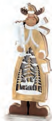
1XM421.18 renna piccola small reindeer 8,5x5x23h AAA