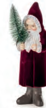
1XM467.10 Babbo Natale piccolo rosso small Santa Claus, red 8x8x25h

Decorazioni da appoggio. Standing decorations.