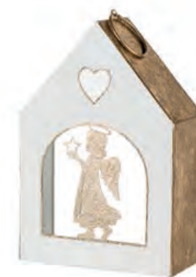
1XM434.14 casetta con angelo con t-light house with angel, with t-light 12,5x5,5x18,5h