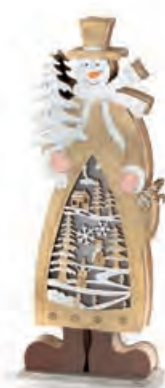
1XM421.16 pupazzo di neve piccolo small snowman 8,5x5x23h AAA