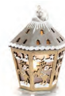
1XM421.10 lanterna argento lantern, silver 11x12,5x17h AG13