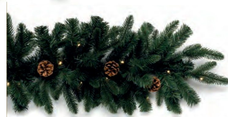
festone verde con pigne green garland with pinecones 1XM415.10 120 cm _ 20 leds 1XM416.10 180 cm _ 30 leds AA