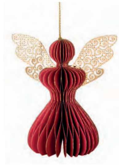
1XM447.11 angelo grande rosso large angel, red 9x13,5x15h