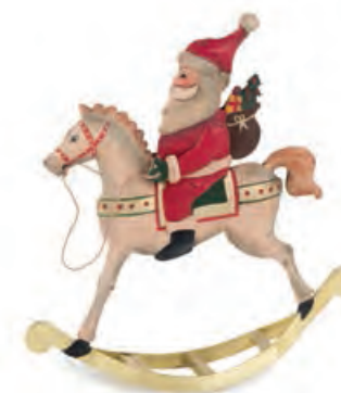
1XM443.12 cavallo con Babbo Natale horse with Santa Claus 15x4x17h

Decorazioni in metallo da appoggio. Standing metal decorations.