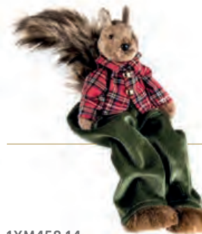
1XM458.14 scoiattolo "lui" seduto sitting squirrel "he" 18h