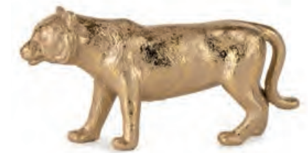
1XM472.10 tigre tiger 19x4x9h