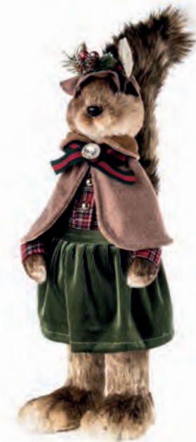
1XM457.11 scoiattolo "lei" squirrel "she" 55h