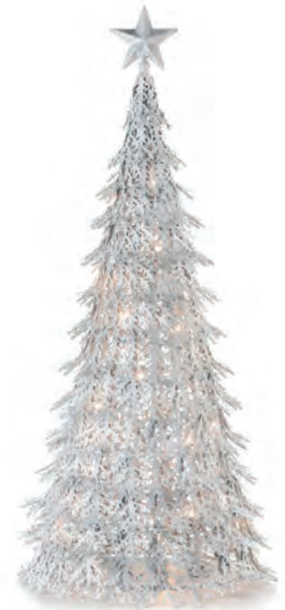
1XM484.10 albero piccolo small tree ø 28x64h

BRILLANO LIEVI * DELICATE LUCI INCANTATE, SARÀ BELLO ASPETTARTI MENTRE CADE LA NEVE