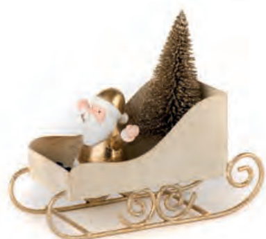
1XM435.10 slitta con Babbo Natale sleigh with Santa Claus 13,5x5x11h