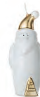
1XM428.15 Babbo Natale piccolo small Santa Claus 14h