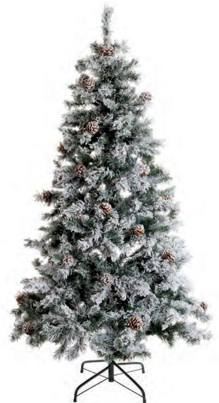
albero con neve e pigne tree with snow and pinecones 1XM410.10 120h _ 110 leds 1XM411.10 180h _ 280 leds 1XM412.10 210h _ 370 leds

È L'ALBERO CHE CI EMOZIONA INTORNO AL QUALE CI RITROVEREMO