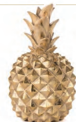
1XM474.12 ananas grande large pineapple ø 11x19h