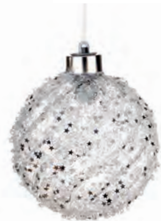
1XM426.10 palla grande · 1 large ball · 1 ø 10 AG13