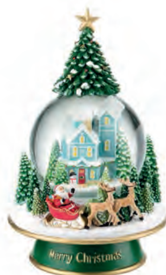
1XM483.11 boule de neige · 2 snowball · 2 ø 14x22h