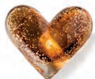
1XM462.14 press-papier cuore ambra heart paperweight, amber 9x8x3,5