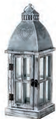
1XM454.10 lanterna piccola small lantern 14x14x40h