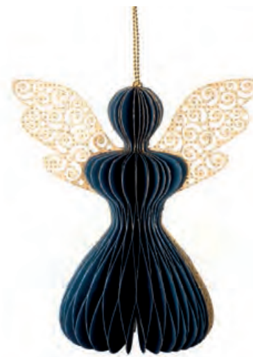
1XM447.17 angelo grande blu large angel, blue 9x13,5x15h