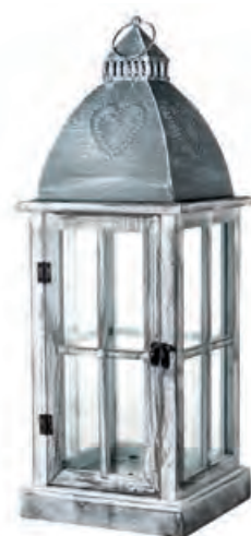
1XM454.11 lanterna grande large lantern 21x21x58h