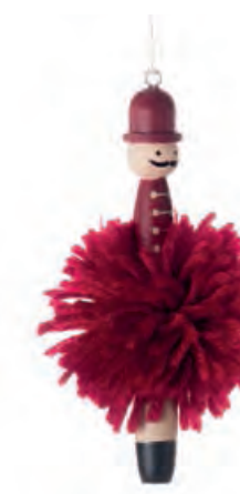
1XM463.11 soldatino da appendere hanging soldier 11h