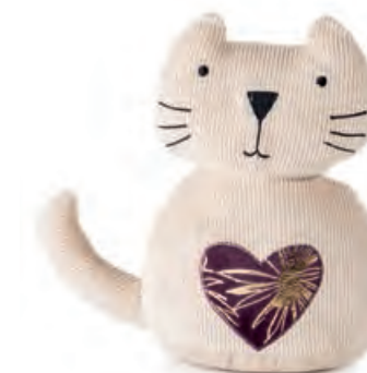
1XM461.11 fermaporta gatto beige door stopper cat, beige 14x25x30h