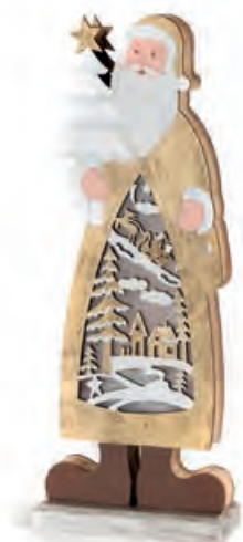
1XM421.15 Babbo Natale grande large Santa Claus 12x6x33h AAA