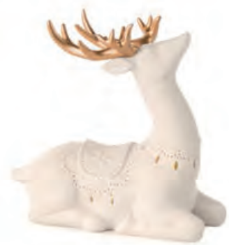
1XM453.10 renna seduta sitting reindeer 17x7x15h AG13

Decorazioni in porcellana da appoggio con luce led _ batterie AG13 · AA comprese. Standing porcelain decorations with led light _ AG13 · AA batteries included.