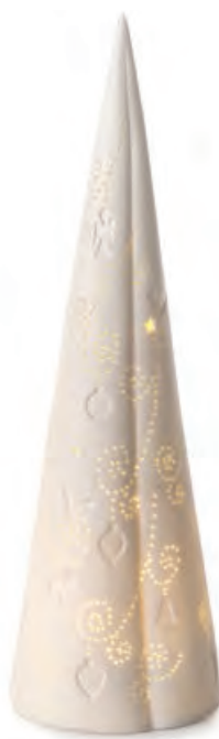
1XM453.15 albero grande large tree ø 12x40h AA