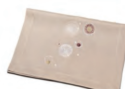
1XM481.12 runner ecrù palle runner with balls, ecru 50x140