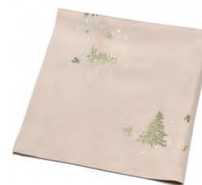
1XM482.10 tovaglia ecrù alberi tablecloth with trees, ecru 85x85

Tovaglia con ricamo, ecrù. Tablecloth with embroidery, ecru.