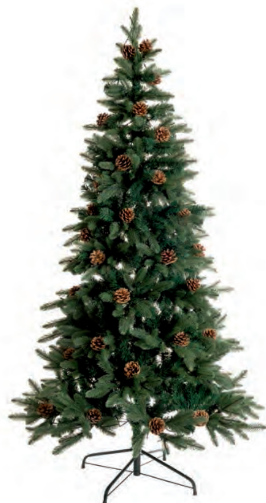
albero verde con pigne green tree with pinecones 1XM407.10 120h _ 110 leds 1XM408.10 180h _ 280 leds 1XM409.10 210h _ 370 leds

UN ALBERO SFAVILLA DI LUCI, AL CENTRO DELLA CASA