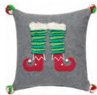
1XM441.12 cuscino quadrato grigio square cushion, grey 30x30