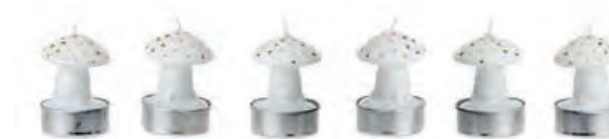
1XM428.10 t-light fungo mushroom t-light set 6 pcs. _ 6h