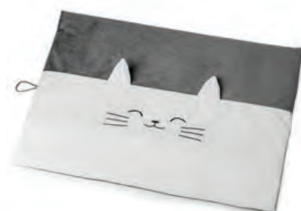
1XM475.12 tappeto rettangolare rectangular carpet 70x50x2h