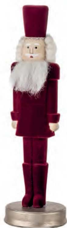
1XM468.10 soldatino rosso soldier, red ø 9x32h