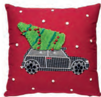
1XM441.13 cuscino quadrato rosso square cushion, red 45x45