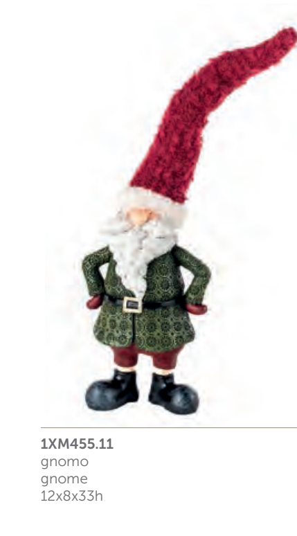
1XM455.11 gnomo gnome 12x8x33h