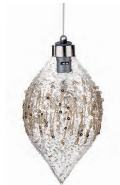
1XM426.15 ovale · 2 oval · 2 ø 8x16h AG13

BAGLIORI, RIFLESSI, SPLENDORE! IN QUESTA MERAVIGLIA * * * VOLANO LIEVI INCANTATE FANTASIE