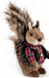
1XM458.10 scoiattolo piccolo "lui" small squirrel "he" 21h

Decorazioni da appoggio in tessuto e fibre naturali. Standing decorations of fabric and natural fibres.