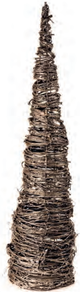
1XM433.12 cono grande 120 leds large cone, 120 leds 90h

UN LEGGERO TINTINNIO DI CRISTALLI ACCOMPAGNA RIFLESSI DORATI E MUSICHE DOLCI LA CASA È ACCOGLIENTE E SERENA, VI STIAMO ASPETTANDO!