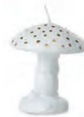
1XM428.11 fungo mushroom 8,5h