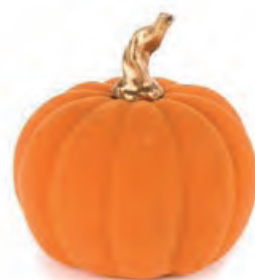
1XM438.11 zucca piccola arancione small pumpkin, orange ø 9x9h