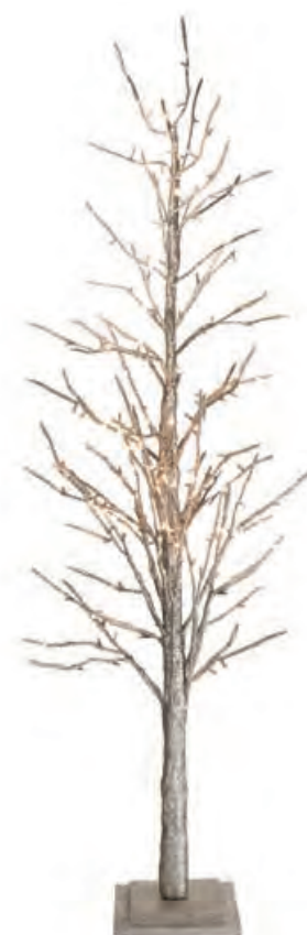
1XM431.10 albero 186 leds tree 186 leds 150h