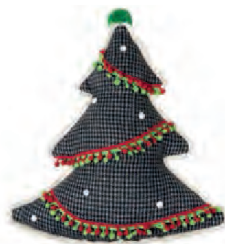
1XM441.11 cuscino albero cushion tree 29x43