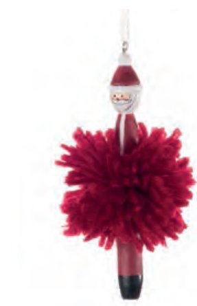
1XM463.10 Babbo Natale da appendere hanging Santa Claus 11h