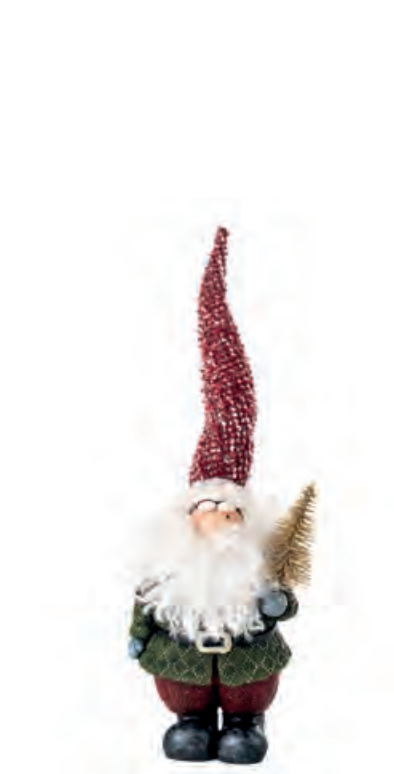
1XM455.12 gnomo con albero gnome with tree 12x10x33h