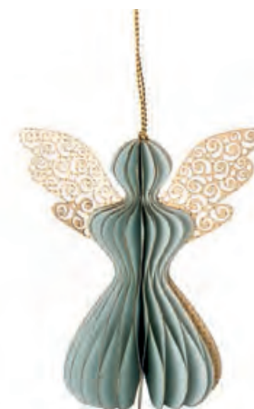
1XM447.12 angelo piccolo verde small angel, green 7x10,5x12h