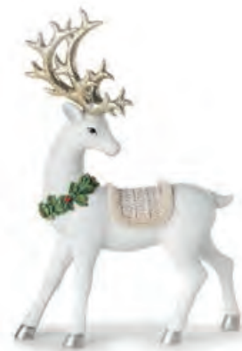
1XM448.11 renna in piedi standing reindeer 17x5x24h