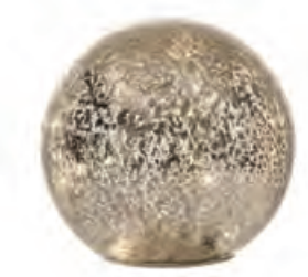
1XM424.10 sfera piccola small sphere ø 15 AA