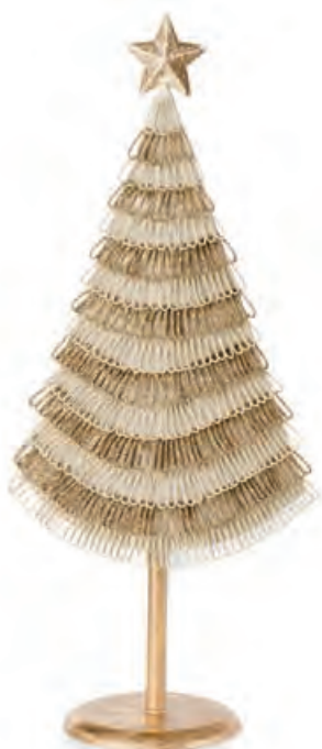
1XM435.17 albero grande large tree 37h