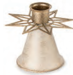
1XM436.10 portacandela stella candle holder star 8h