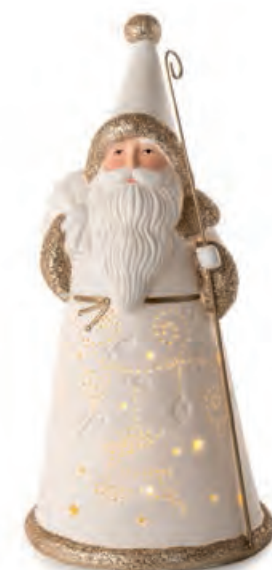
1XM453.13 Babbo Natale grande large Santa Claus 12x12x25h AA