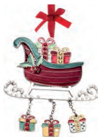
1XM444.12 slitta sleigh 10h