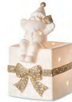
1XM439.12 pacco con Babbo Natale grande large gift with Santa Claus 13x15x21h AA