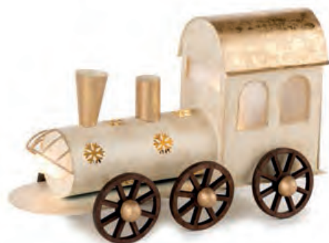
1XM435.18 trenino con led train, with leds 24x11x14h AAA

Decorazioni in metallo da appoggio _ batterie AAA. Standing metal decorations _ AAA batteries.