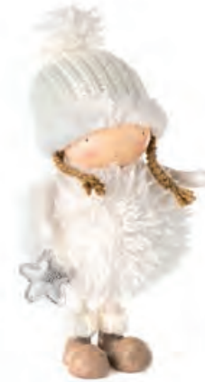
1XM456.14 bambina little girl 17x17x36h

Decorazioni da appoggio. Standing decorations.