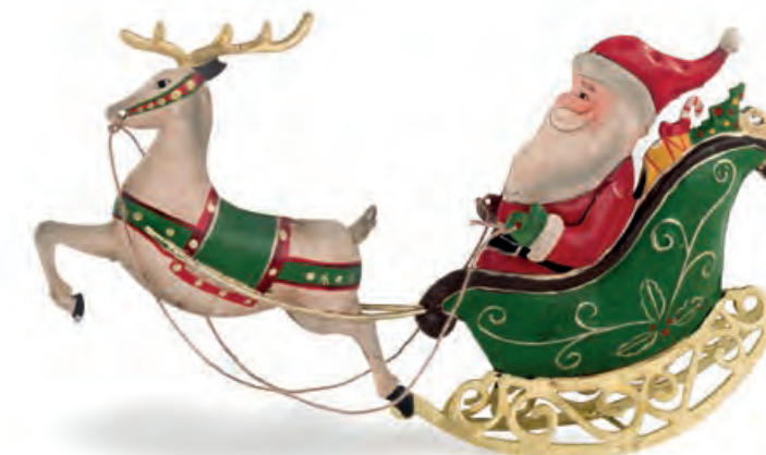
1XM443.10 renna con Babbo Natale reindeer with Santa Claus 24x3x12h