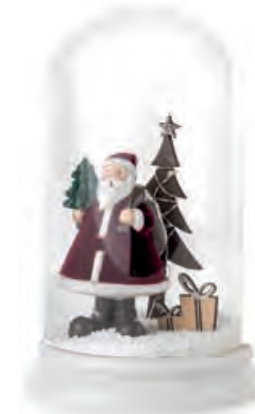
1XM465.11 cloche media medium cloche ø 12x19h CR2032