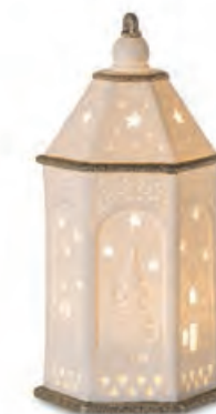
1XM439.14 lanterna lantern 9x9x20h AA