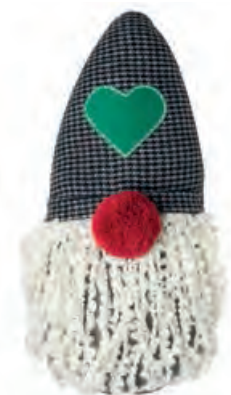
1XM441.10 cuscino Babbo Natale cushion Santa Claus 25x45