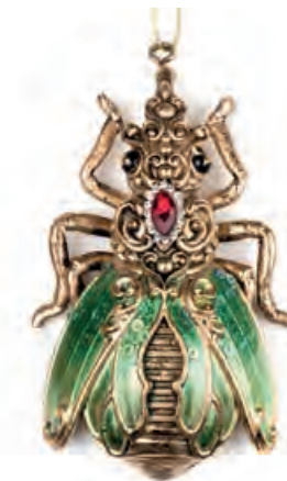
1XM437.14 bijou d'arredo · 5 decorative bijou · 5 6x10