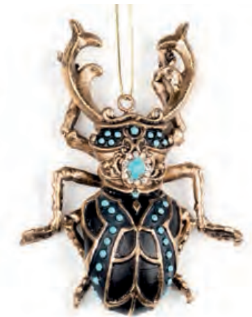
1XM437.11 bijou d'arredo · 2 decorative bijou · 2 8x10