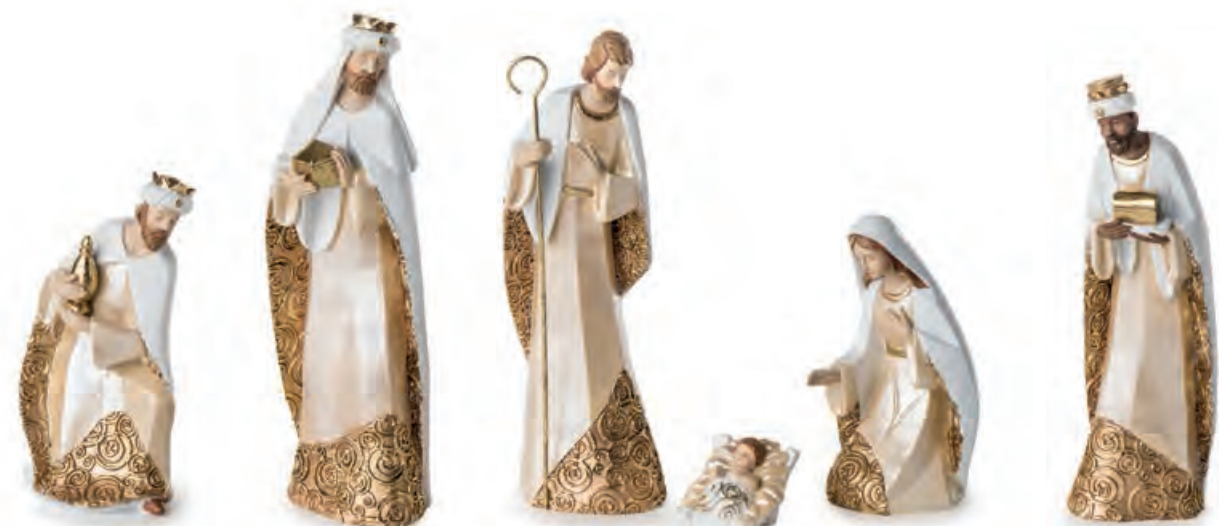
1XM451.10 natività nativity 20h max

Decorazioni da appoggio, set 6 pcs. Standing decorations, set 6 pcs.