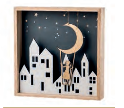
1XM422.12 paesaggio con altalena landscape with swing 24x4,5x24h