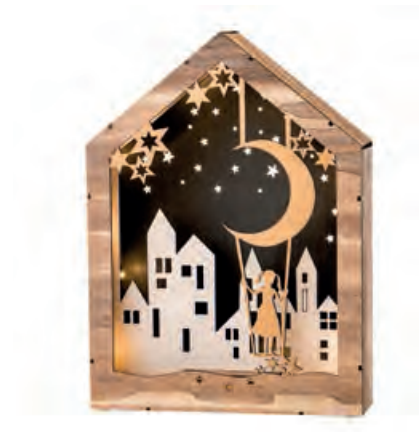
1XM422.10 paesaggio con altalena, con led landscape with swing, with leds 22x6x30h AA

Decorazioni in legno, da appendere e da appoggio _ batterie AA. Hanging and standing wooden decorations _ AA batteries.