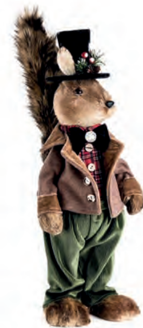
1XM457.10 scoiattolo "lui" squirrel "he" 60h

Decorazioni da appoggio in tessuto e fibre naturali. Standing decorations of fabric and natural fibres.