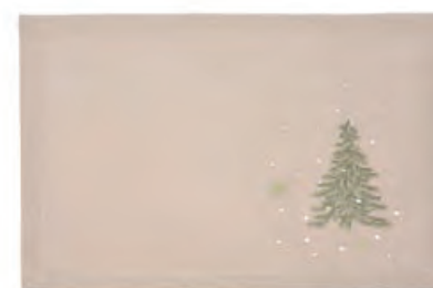
1XM480.10 tovaglietta ecrù alberi placemat with trees, ecru 33x48

Tovaglietta da colazione con ricamo, ecrù. Placemat with embroidery, ecru.