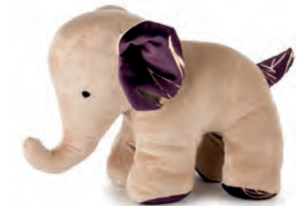
1XM461.15 fermaporta elefante beige door stopper elephant, beige 28x13x22h