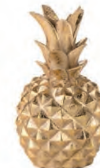
1XM474.11 ananas piccolo small pineapple ø 8x13h