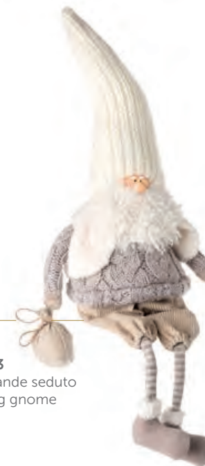
1XM456.13 gnomo grande seduto large sitting gnome 25x15x48h