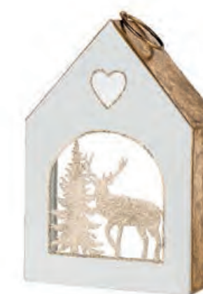
1XM434.16 casetta con renna con t-light house with reindeer, with t-light 12,5x5,5x18,5h