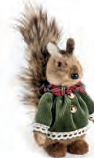
1XM458.11 scoiattolo piccolo "lei" small squirrel "she" 21h