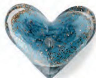
1XM462.11 press-papier cuore blu heart paperweight, blue 9x8x3,5