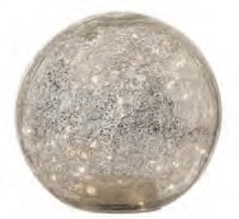
1XM424.11 sfera grande large sphere ø 20 AA