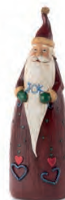
1XM440.12 Babbo Natale joy Santa Claus joy 7x5x21h

Decorazioni da appoggio. Standing decorations.