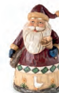
1XM440.10 Babbo Natale con borsa Santa Claus with bag 10x9x15h