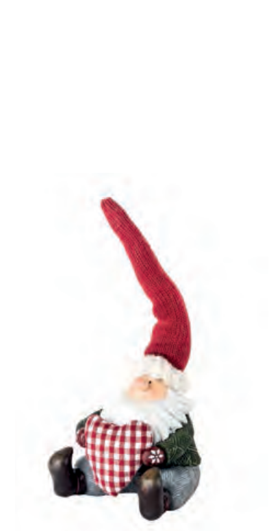
1XM455.10 gnomo con cuore gnome with heart 10x10x22h

Decorazioni da appoggio. Standing decorations.