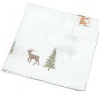
1XM479.10 tovaglia bianca renna e albero tablecloth with reindeer and tree, white 85x85

Tovaglia con ricamo, bianco. Tablecloth with embroidery, white.