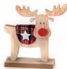
1XM423.10 alce piccolo small elk 9x4x11h