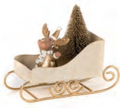
1XM435.11 slitta con renna sleigh with reindeer 13,5x5x11h