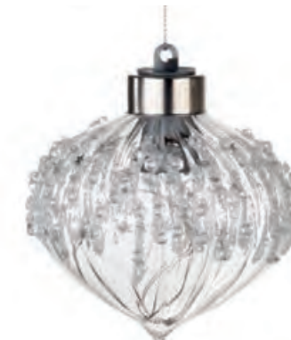
1XM425.14 cipolla · 1 onion · 1 ø 8 AG13