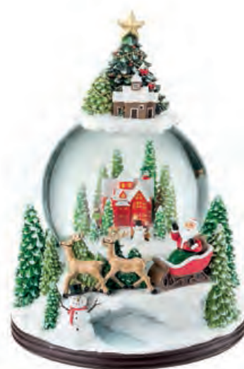
1XM483.13 boule de neige · 4 snowball · 4 ø 17x24h