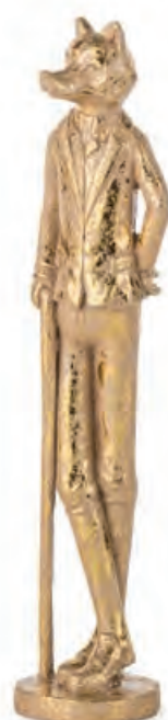
1XM473.11 volpe fox ø 4x22h