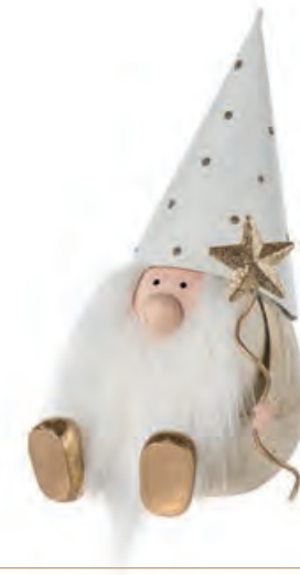
1XM436.17 gnomo grande con stella large gnome with star 17h