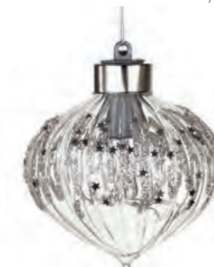
1XM425.16 cipolla · 3 onion · 3 ø 8 AG13