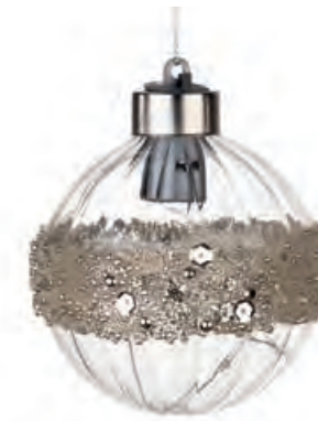
1XM425.13 palla piccola · 4 small ball · 4 ø 8 AG13