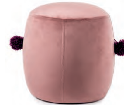
1XM460.11 mini pouf rosa mini pouf, pink ø 30x30h