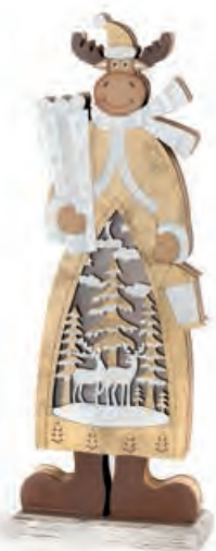
1XM421.19 renna grande large reindeer 12x6x33h AAA