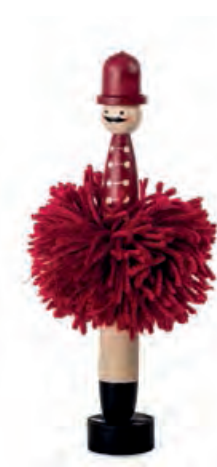
1XM463.14 soldatino soldier 21h