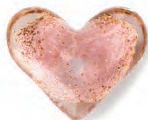
1XM462.13 press-papier cuore rosa heart paperweight, pink 9x8x3,5