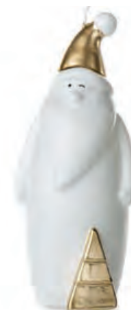
1XM428.17 Babbo Natale grande large Santa Claus 22h