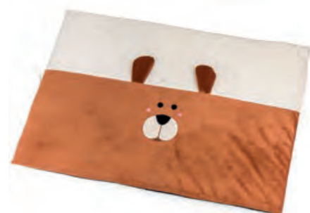
1XM476.12 tappeto rettangolare rectangular carpet 70x50x2h