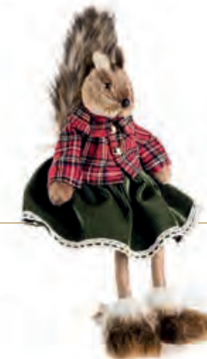
1XM458.15 scoiattolo "lei" seduto sitting squirrel "she" 18h