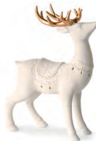
1XM453.11 renna in piedi standing reindeer 15x7x21h AG13