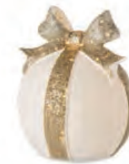
1XM439.10 palla ball ø 10x10h AG13