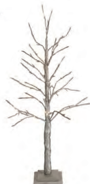
1XM429.10 albero 78 leds tree 78 leds 90h

PREZIOSE SCINTILLE * DI PICCOLE LUCI CHE SEMBRANO STELLE BRILLERANNO PER NOI CHE SAPREMO ASCOLTARLE