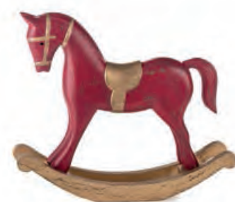
1XM466.10 cavallo a dondolo piccolo small rocking horse 38x8x32h