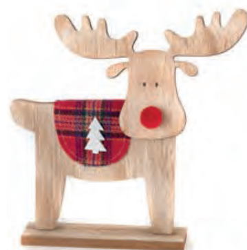
1XM423.11 alce grande large elk 22x4x22h