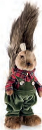
1XM458.12 scoiattolo grande "lui" large squirrel "he" 36h