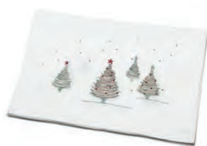
1XM478.11 runner bianco alberi runner with trees, white 50x140