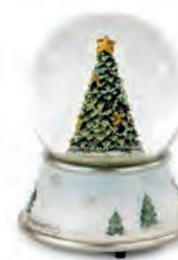
1XM449.12 boule de neige albero snowball tree ø 11x13h