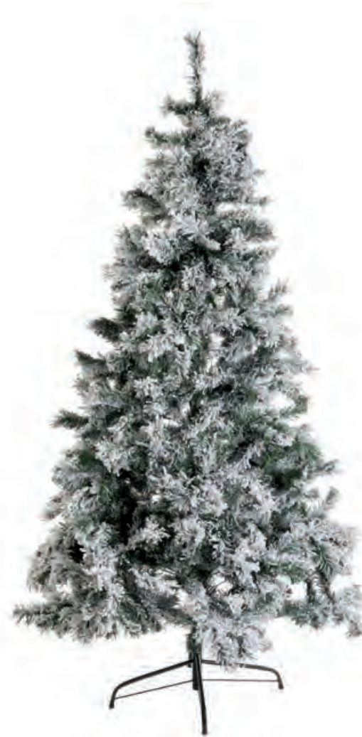
albero con neve tree with snow 1XM404.10 120h _ 110 leds 1XM405.10 180h _ 280 leds 1XM406.10 210h _ 370 leds