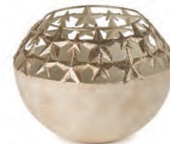
1XM436.14 porta t-light stelle grande con t-light large t-light holder stars with t-light ø 14x11h