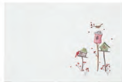
1XM477.12 tovaglietta bianca casette placemat with houses, white 33x48