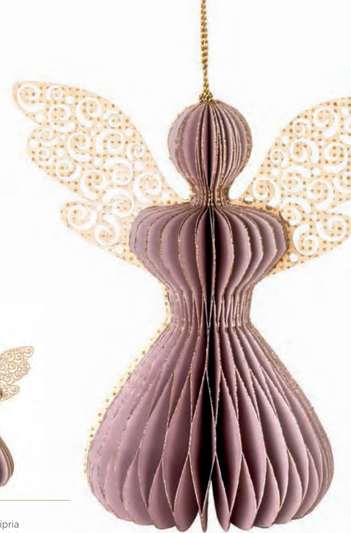
1XM447.15 angelo grande cipria large angel, pale pink 9x13,5x15h