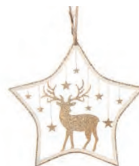
1XM434.10 stella piccola small star 12h

Decorazioni in metallo da appendere. Hanging metal decorations.