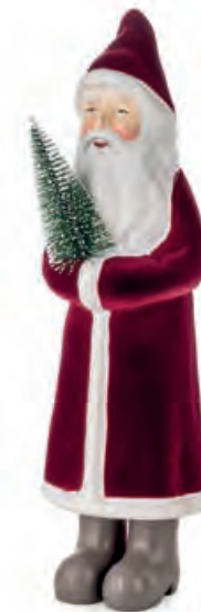
1XM467.12 Babbo Natale grande rosso large Santa Claus, red 12x12x42h