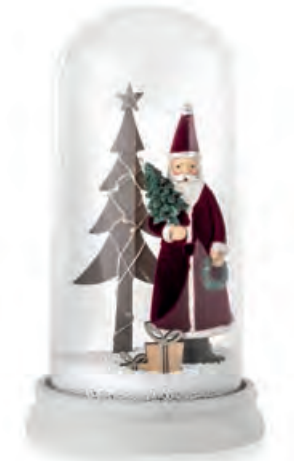
1XM465.12 cloche grande large cloche ø 12x22h CR2032