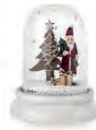
1XM465.10 cloche piccola small cloche ø 9x11h CR2032

Decorazioni da appoggio con luce led _ batterie CR2032. Standing decorations with led light _ CR2032 batteries.