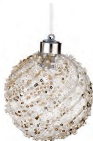
1XM426.11 palla grande · 2 large ball · 2 ø 10 AG13