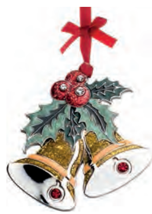
1XM444.11 campanelle bells 9h