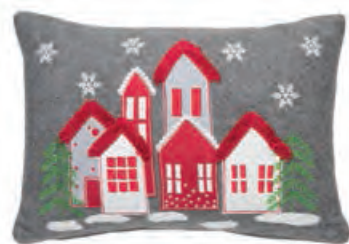
1XM441.14 cuscino rettangolare grigio rectangular cushion, grey 30x45