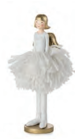
1XM463.15 ballerina con caschetto ballerina with bob cut 18h