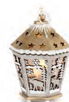
1XM421.11 lanterna oro lantern, gold 11x12,5x17h AG13

ACCENDEREMO LUCI DORATE AD INDICARE LA STRADA PER CHI VORRÀ AMARE, PER CHI VORRÀ GIOIRE.