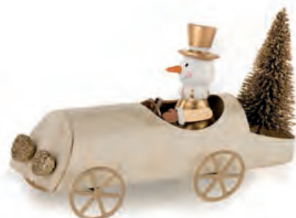
1XM435.15 macchina con pupazzo di neve car with snowman 17x6x10h