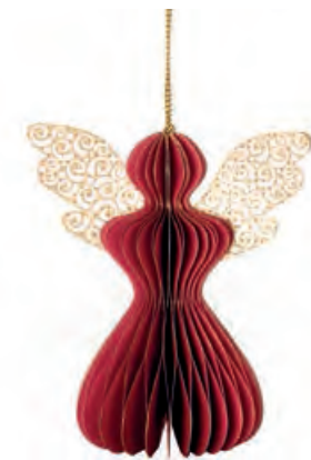
1XM447.10 angelo piccolo rosso small angel, red 7x10,5x12h