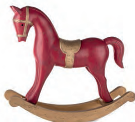
1XM466.11 cavallo a dondolo grande large rocking horse 50x11x45h