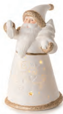
1XM453.12 Babbo Natale piccolo small Santa Claus 11x10x19h AA