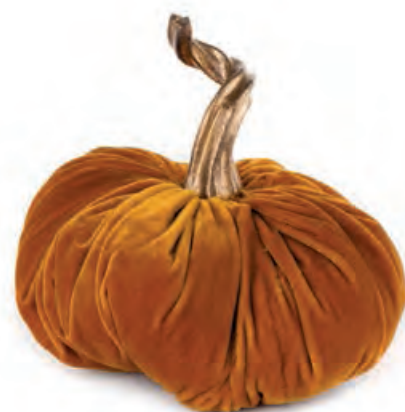
1XM438.13 zucca media ambra medium pumpkin, amber ø 18x15h