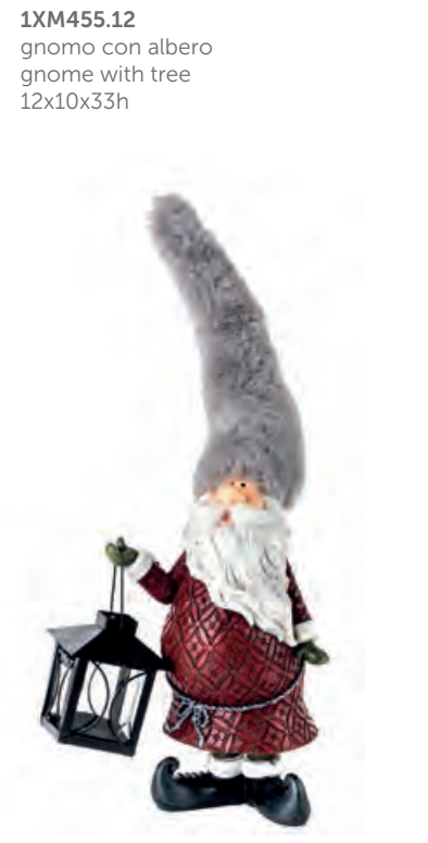
1XM455.15 gnomo con lanterna · t-light led gnome with lantern · led t-light 20x12x40h