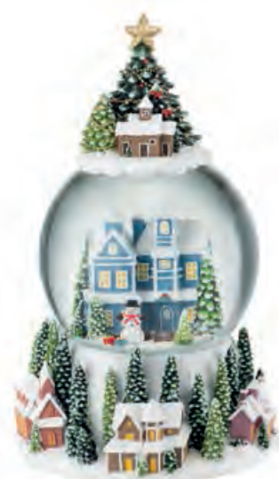
1XM483.12 boule de neige · 3 snowball · 3 ø 14x23h