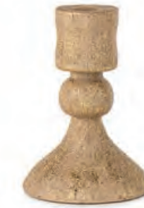
1XM471.10 candelabro basso short candlestick ø 9x13h

Decorazioni da appoggio. Standing decorations.