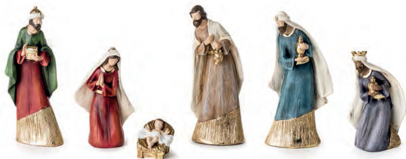
1XM450.10 natività nativity 18h max

Decorazioni da appoggio, set 6 pcs. Standing decorations, set 6 pcs.