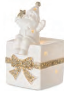
1XM439.11 pacco con Babbo Natale piccolo small gift with Santa Claus 11x9x16h AG13

Decorazioni in porcellana da appoggio con luce led _ batterie AG13 - AA comprese Standing porcelain decorations with led light _ AG13 - AA batteries included.