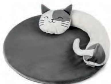
1XM475.11 tappeto tondo round carpet ø 50x10h