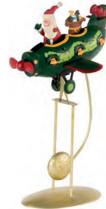
1XM442.11 aereo con Babbo Natale airplane with Santa Claus 19x18x32h