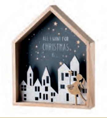
1XM422.13 paesaggio con bambina landscape with little girl 20x4,5x25h