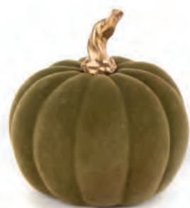
1XM438.10 zucca piccola verde small pumpkin, green ø 9x9h

Decorazioni da appoggio. Standing decorations.