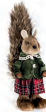
1XM458.13 scoiattolo grande "lei" large squirrel "she" 36h