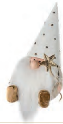
1XM436.16 gnomo piccolo con stella small gnome with star 13h

Decorazioni da appoggio. Standing decorations.