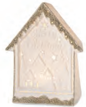
1XM439.13 casetta house 15x9x18h AA