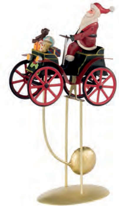
1XM442.12 macchina con Babbo Natale car with Santa Claus 18x9x35h