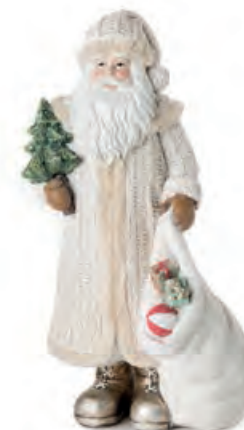
1XM448.12 Babbo Natale piccolo small Santa Claus 8x12x21h