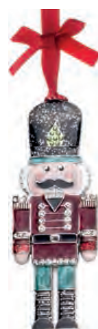
1XM444.14 soldatino soldier 10h