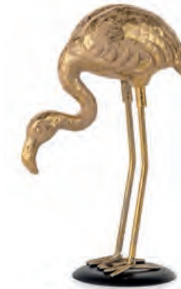
1XM472.11 fenicottero · 2 flamingo · 1 12x6x18h