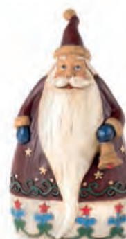
1XM440.13 Babbo Natale con campanella Santa Claus with bell 10x6x18h