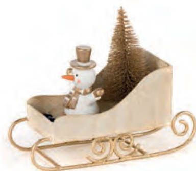
1XM435.12 slitta con pupazzo di neve sleigh with snowman 13,5x5x11h