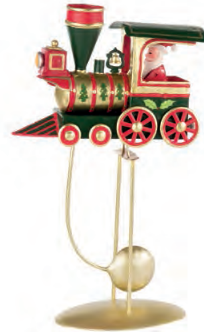
1XM442.10 treno con Babbo Natale train with Santa Claus 19x9x33h

Decorazioni in metallo da appoggio. Standing metal decorations.