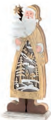
1XM421.14 Babbo Natale piccolo small Santa Claus 8,5x5x23h AAA