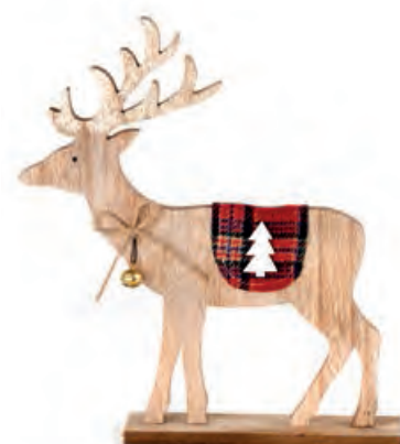
1XM423.13 renna grande large reindeer 21x4x25h