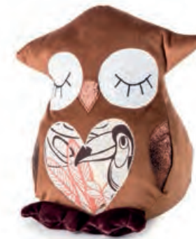
1XM461.12 fermaporta civetta marrone door stopper owl, brown 18x25x26h

Fermaporta in tessuto imbottito. Padded fabric door stoppers.