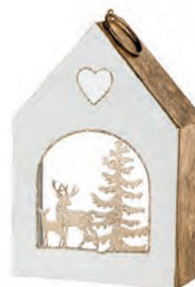
1XM434.15 casetta con renne con t-light house with reindeers, with t-light 12,5x5,5x18,5h