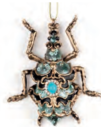
1XM437.12 bijou d'arredo · 3 decorative bijou · 3 8x9