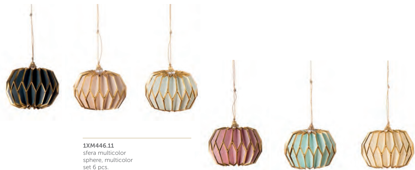
1XM446.11 sfera multicolor sphere, multicolor set 6 pcs. ø 8