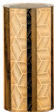
1XM427.11 fontana luminosa · 2 luminous fountain · 2 ø 9x18h C