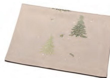
1XM481.10 runner ecrù alberi runner with trees, ecru 50x140

Runner con ricamo, ecrù. Runner with embroidery, ecru.