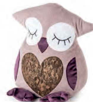
1XM461.13 fermaporta civetta rosa door stopper owl, pink 18x25x26h