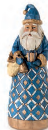
1XM440.17 Babbo Natale con pacchetto Santa Claus with gift 12x10x32h