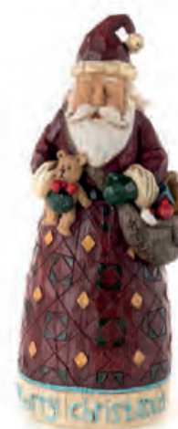
1XM440.16 Babbo Natale con orsacchiotto Santa Claus with bear 11x10x28h