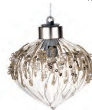
1XM425.15 cipolla · 2 onion · 2 ø 8 AG13