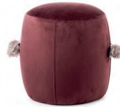
1XM460.10 mini pouf bordeaux mini pouf, burgundy ø 30x30h