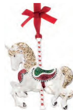
1XM444.15 cavallo horse 9h