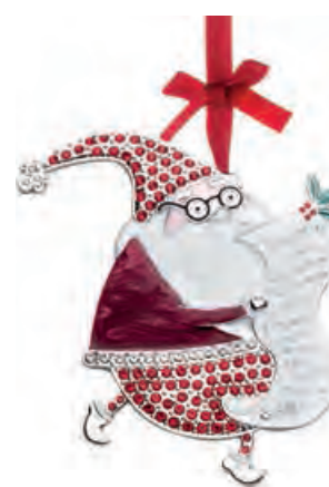
1XM444.13 Babbo Natale Santa Claus 10h