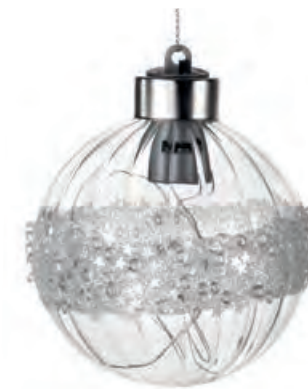
1XM425.10 palla piccola · 1 small ball · 1 ø 8 AG13

Decorazioni con luce led, da appendere _ batterie AG13 comprese. Hanging decorations with led light _ AG13 batteries included.