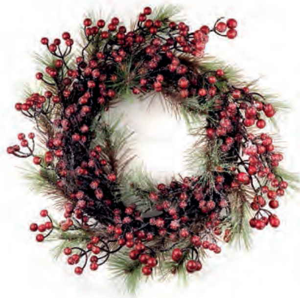
1XM459.10 ghirlanda piccola small wreath ø 40