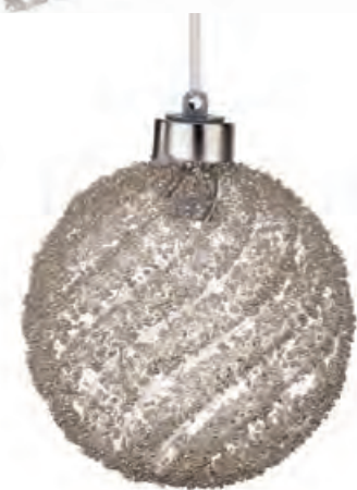
1XM426.13 palla grande · 4 large ball · 4 ø 10 AG13

BAGLIORI, RIFLESSI, SPLENDORE! IN QUESTA MERAVIGLIA * * * VOLANO LIEVI INCANTATE FANTASIE