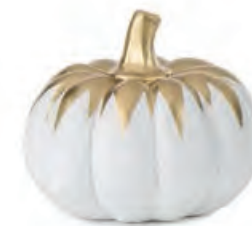
1XM474.10 zucca pumpkin ø 11x9h

Decorazioni da appoggio. Standing decorations.