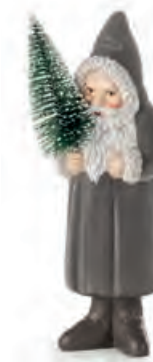
1XM467.11 Babbo Natale piccolo grigio small Santa Claus, grey 8x8x25h