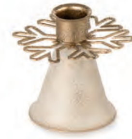
1XM436.11 portacandela fiocco di neve candle holder snowflake 8h