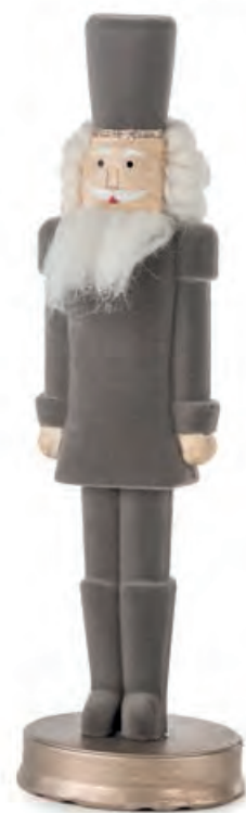
1XM468.11 soldatino grigio soldier, grey ø 9x32h