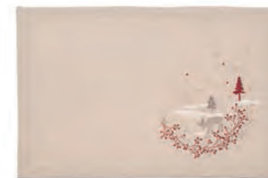
1XM480.11 tovaglietta ecrù alberi e renna placemat with trees and reindeer, ecru 33x48