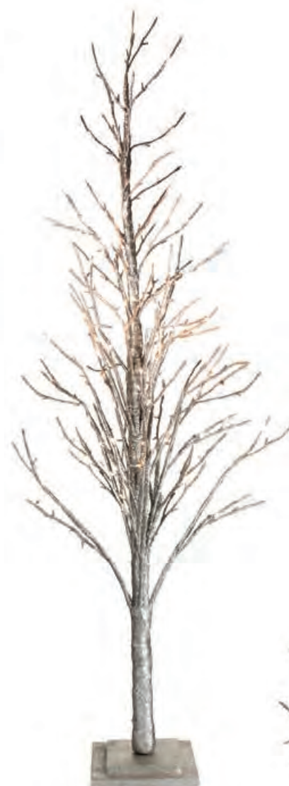
1XM432.10 albero 270 leds tree 270 leds 180h