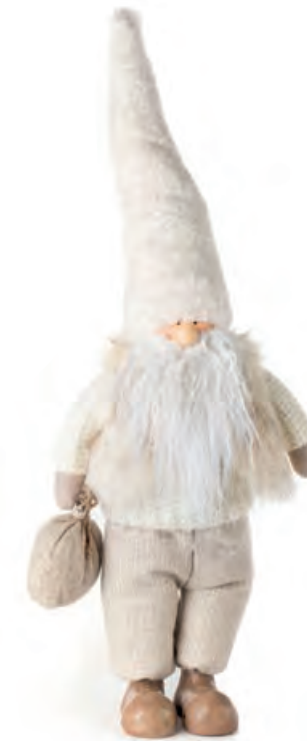
1XM456.15 gnomo gnome 25x15x58h