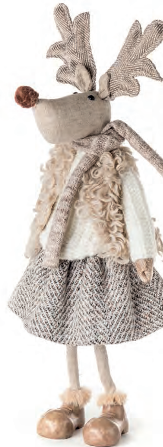
1XM456.11 alce grande large elk 25x15x52h