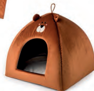
1XM476.13 cuccia igloo igloo house 50x50x47h