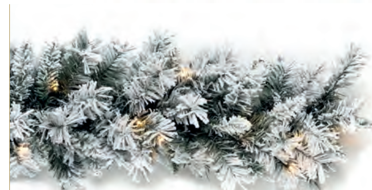
festone con neve garland with snow 1XM417.10 120 cm _ 20 leds 1XM418.10 180 cm _ 30 leds AA