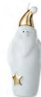
1XM428.16 Babbo Natale medio medium Santa Claus 16h