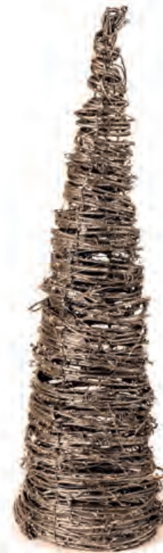
1XM433.11 cono medio 80 leds medium cone, 80 leds 60h

Elementi decorativi con luce led _ alimentazione 220V. Decorative objects with led light _ 220V power supply.