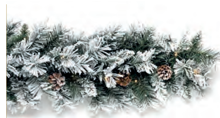
festone con neve e pigne garland with snow and pinecones 1XM419.10 120 cm _ 20 leds 1XM420.10 180 cm _ 30 leds AA