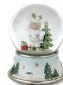
1XM449.11 boule de neige renna snowball reindeer ø 11x13h