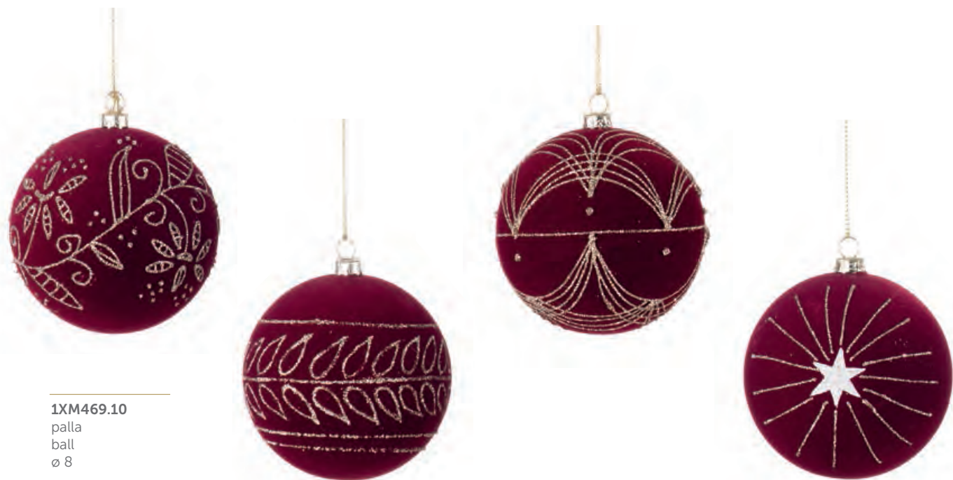
1XM469.10 palla ball ø 8