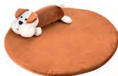
1XM476.11 tappeto tondo round carpet ø 65x15h