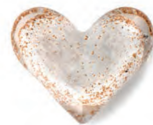
1XM462.15 press-papier cuore bianco heart paperweight, white 9x8x3,5