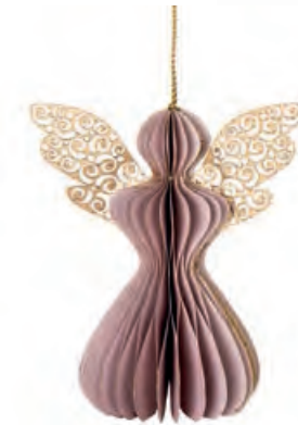
1XM447.14 angelo piccolo cipria small angel, pale pink 7x10,5x12h