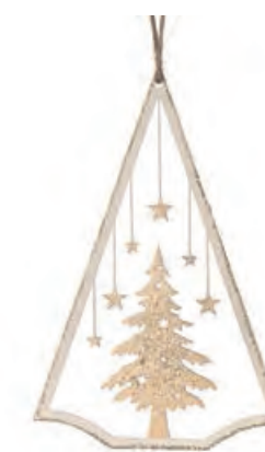
1XM434.12 albero piccolo small tree 15,5h