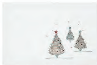
1XM477.11 tovaglietta bianca alberi placemat with trees, white 33x48