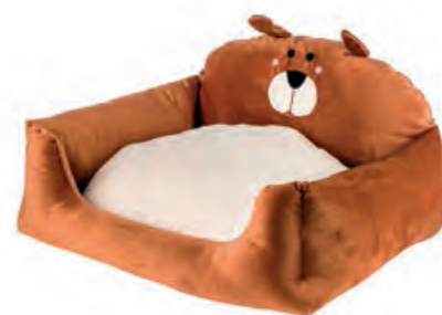
1XM476.10 poltroncina chair 60x60x30h

Accessori imbottiti per il cane. Padded accessories for dogs.