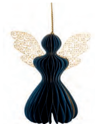
1XM447.16 angelo piccolo blu small angel, blue 7x10,5x12h