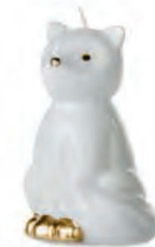
1XM428.14 volpe fox 10h