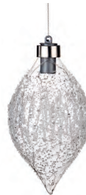
1XM426.14 ovale · 1 oval · 1 ø 8x16h AG13