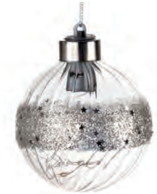
1XM425.12 palla piccola · 3 small ball · 3 ø 8 AG13