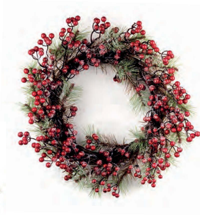
1XM459.11 ghirlanda grande large wreath ø 45

APRIAMO LE PORTE AL NATALE, ACCOGLIAMO GLI OSPITI: LA NOSTRA CASA È PRONTA, VI ASPETTIAMO PER BRINDARE