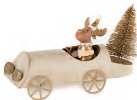
1XM435.14 macchina con renna car with reindeer 17x6x10h