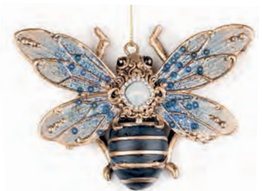
1XM437.15 bijou d'arredo · 6 decorative bijou · 6 11x8