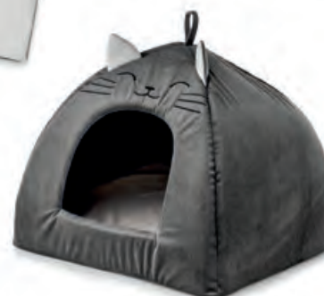
1XM475.13 cuccia igloo igloo house 40x40x35h