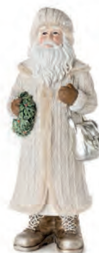
1XM448.13 Babbo Natale grande large Santa Claus 14x11x32h