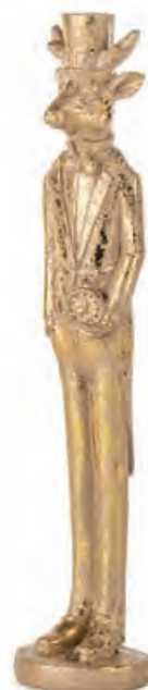
1XM473.10 renna reindeer ø 4x20h

Decorazioni da appoggio. Standing decorations.