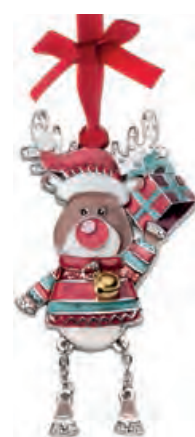
1XM444.10 renna reindeer 9h