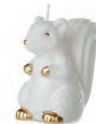
1XM428.13 scoiattolo squirrel 10h