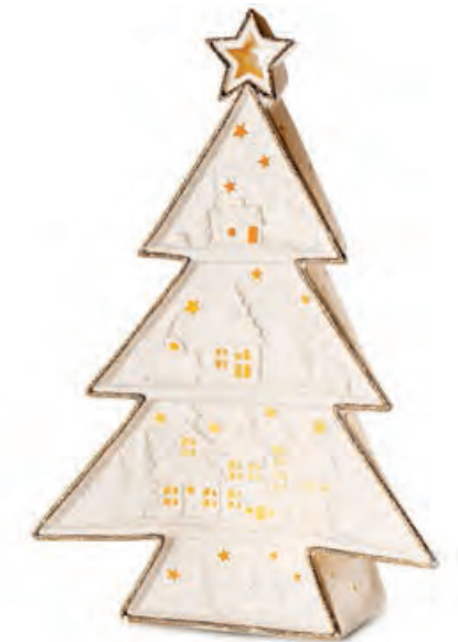
1XM439.16 albero tree 23x11x32h AA