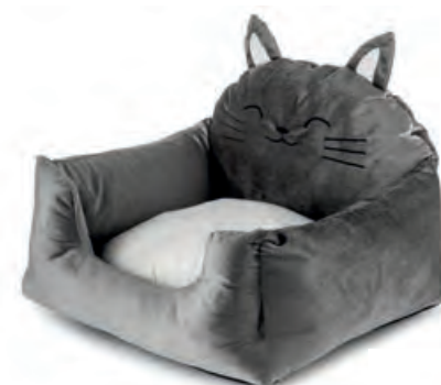
1XM475.10 poltroncina chair 45x45x35h

Accessori imbottiti per il gatto. Padded accessories for cats.