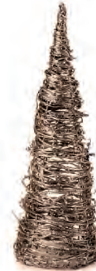
1XM433.10 cono piccolo 50 leds small cone, 50 leds 45h