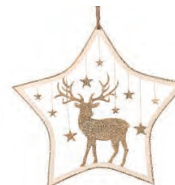
1XM434.11 stella grande large star 16h