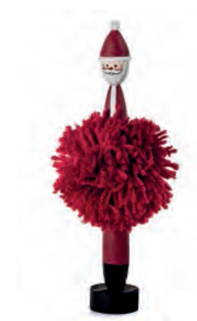
1XM463.13 Babbo Natale Santa Claus 21h

Decorazioni da appendere e da appoggio. Hanging and standing decorations.