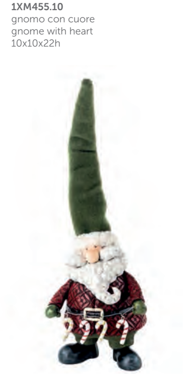
1XM455.13 gnomo con bastoncini di zucchero gnome with candy canes 14x12x40h