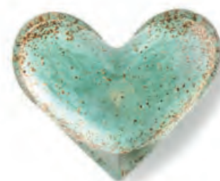
1XM462.12 press-papier cuore acquamarina heart paperweight, aquamarine 9x8x3,5