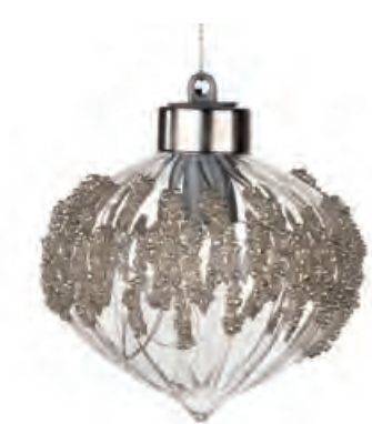
1XM425.17 cipolla · 4 onion · 4 ø 8 AG13