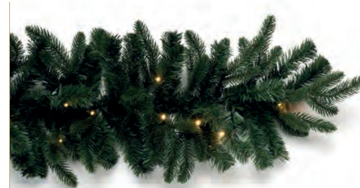
festone verde green garland 1XM413.10 120 cm _ 20 leds 1XM414.10 180 cm _ 30 leds AA

Festoni, con led _ batterie AA. Garlands, with leds _ AA batteries.