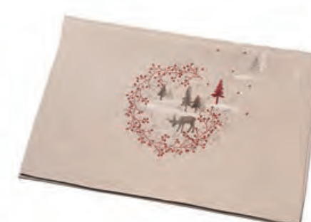
1XM481.11 runner ecrù alberi e renna runner with trees and reindeer, ecru 50x140