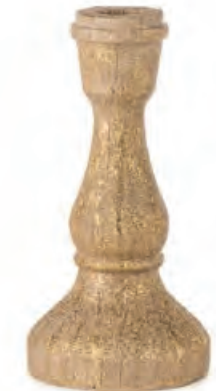
1XM471.11 candelabro alto high candlestick ø 9x18h