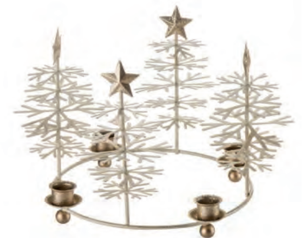
1XM436.15 centrotavola 4 candele centerpiece 4 candles ø 30x20h