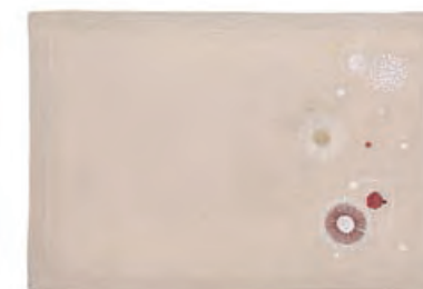
1XM480.12 tovaglietta ecrù palle placemat with balls, ecru 33x48