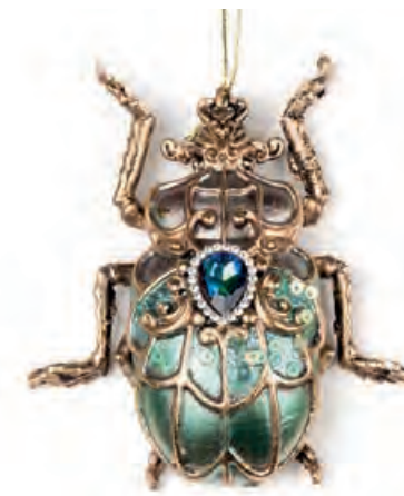
1XM437.10 bijou d'arredo · 1 decorative bijou · 1 8x9

Decorazioni da appendere e da appoggio. Hanging and standing decorations.