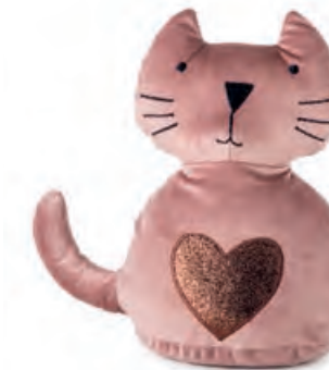
1XM461.10 fermaporta gatto rosa door stopper cat, pink 14x25x30h