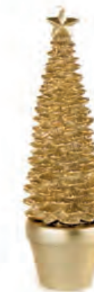
1XM428.19 albero grande large tree 29h