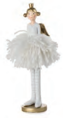
1XM463.16 ballerina con chignon ballerina with chignon 20h