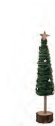
1XM464.10 albero piccolo verde small tree, green ø 7x33h

Decorazioni da appoggio. Standing decorations.